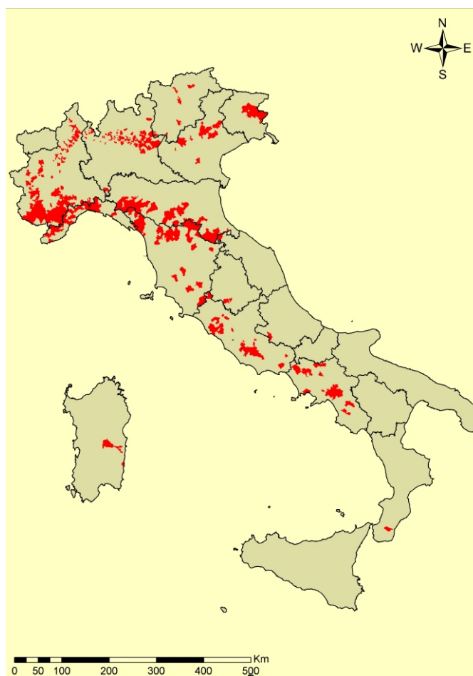
Figura 2 – Diffusione della vespa cinese nelle regioni italiane (Dati 2009)

In attesa di conoscere con precisione i danni causati dal cinipide, sulla base degli studi fin qui condotti e dell'esperienza dei colleghi del Piemonte, si può affermare che i danni fortunatamente non corrispondono all'impatto visivo dell'infestazione in atto. Ci rendiamo conto che le azioni intraprese non rispondono alle legittime richieste di soluzioni immediate che sollecitano i castanicoltori, ma sono le uniche che nel medio- lungo periodo possono risolvere definitivamente il problema.